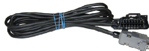
Кабель диагностический ВАЗ-2/Е3 (OBD-II)