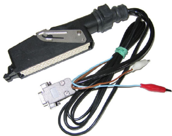
Кабель-55к. программатора контроллеров