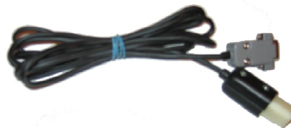
Кабель диагностический ГАЗ-2/ШТАЙЕР