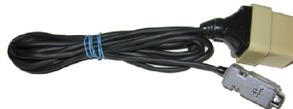
Кабель диагностический ГАЗ-1/Е0/2