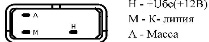
Рис.3. Адресация вилки диагностического кабеля для ВАЗ-ГАЗ-УАЗ (Евро -3/4)